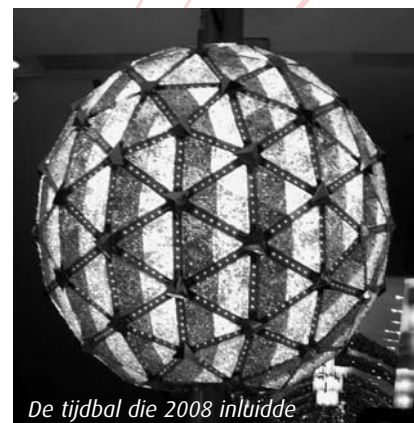
De tijdbal die 2008 inluidde